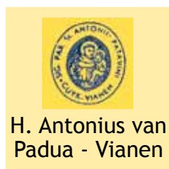
H. Antonius van Padua - Vianen