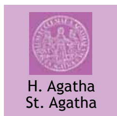
H. Agatha St. Agatha