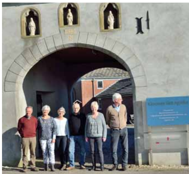
De gastheren en gastvrouwen van het Poortgebouw.

Heb je interesse of wil je meer informatie? Neem contact op met Carli Bakker via: info@kloostersintagatha.nl of 0485 - 311 007 (ma-, di-, woe- en vrijdagmiddag bereikbaar).