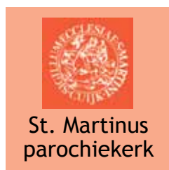
St. Martinus parochiekerk